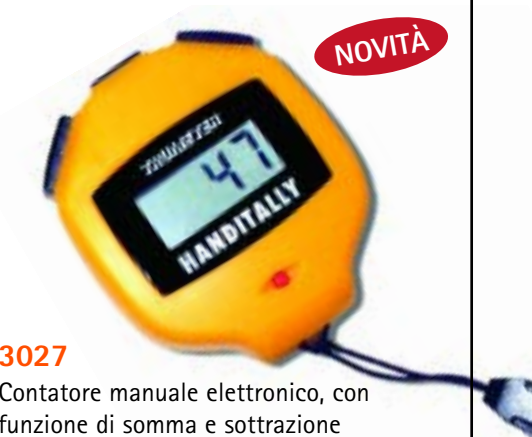
3027 Contatore manuale elettronico, con funzione di somma e sottrazione