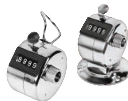
3025 | 3026 Hand tally | Desk tally