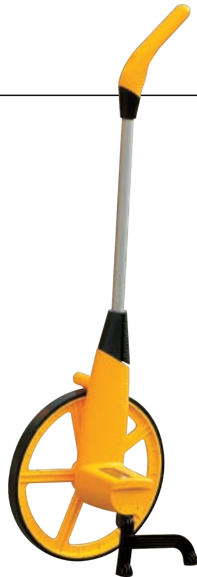
• Modello mostrato 5505E